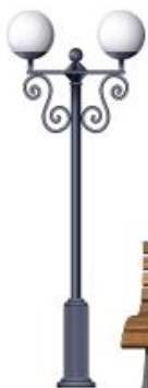
Малые архитектурные формы: