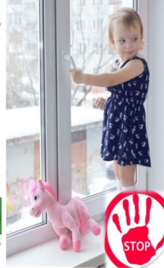
«Ребенок в окне!»